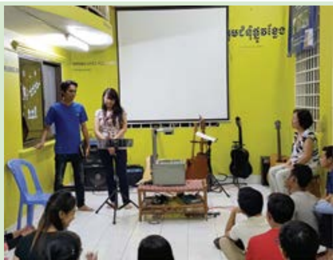
柬埔寨晚上的分享会

所以，做为神的儿女，一名基督徒，勿忘自己先要身体力行。如果你愿意与从没见过的人，分享你的喜乐、祝福有需要的人的话，我鼓励你考虑在圣诞来临之际，把你的圣诞礼物奉献给我们在宣教工厂上的同工，并持续的为CNEC及他们的事工祷告。